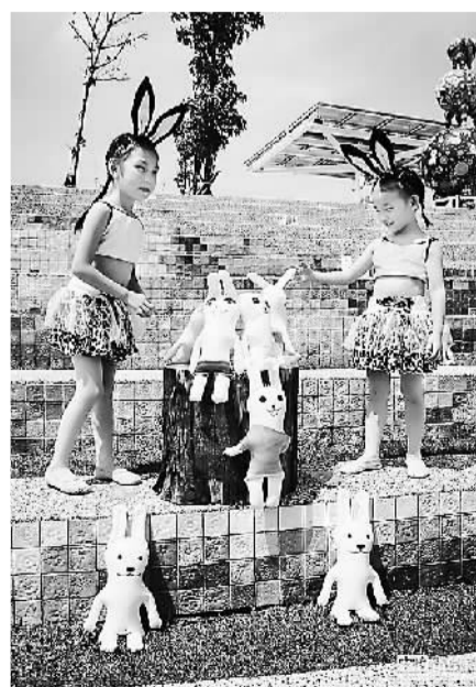
台“客委会”客家文化园区推出“乐舞中秋艺动客庄”系列活动，园区阶梯广场布置有350只颜色各异、造型可爱的小玉兔，馆内一角则有“嫦娥奔月”的气球造景。

月饼自是最不可少的，在台湾，买月饼也可以做慈善。岛内的一些慈善组织与企业合作，吸收残障人士做月饼，为他们增加收入。在超市里，人们可以参加慈善组织举办的为残障学生认捐月饼礼盒的活动，在传统节日里传递一份可以温暖更多人的大爱。