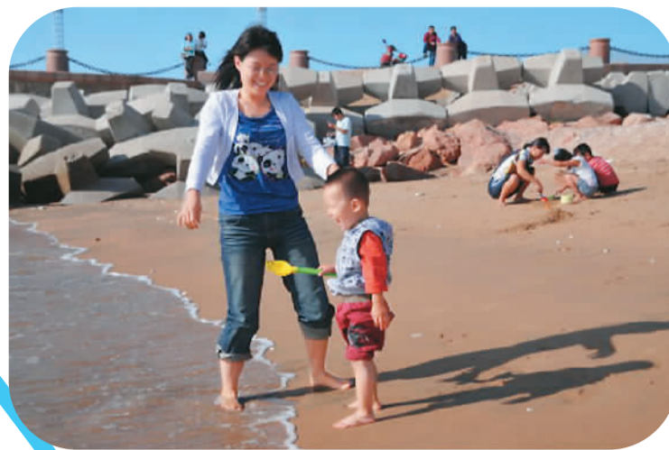
在荣成海边游玩的母子