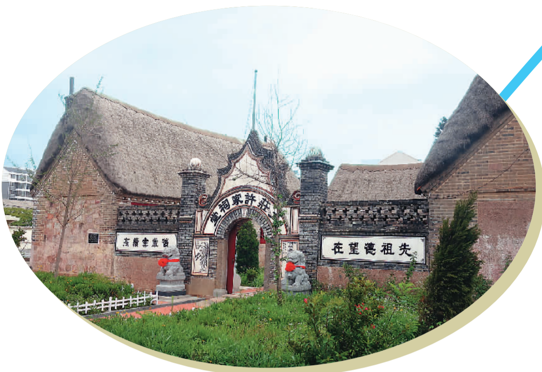
大庄许家祠堂