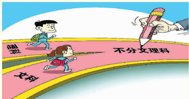
合并 朱慧卿作

就公众普遍关心的高考综合改革,杜玉波表示,一是要改革考试科目设置。具体而言,考生总成绩由统一高考的语文、数学、外语3个科目成绩和高中学业水平考试3个科目成绩组成。其中,保持统一高考的语文、数学、外语科目不变、分值不变,不分文理科,外语科目提供两次考试机会。计入总成绩的高中学业水平考试科目,由考生根据报考高校要求和自身特长,在思想政治、历史、地理、物理、化学、生物等科目中自主选择。