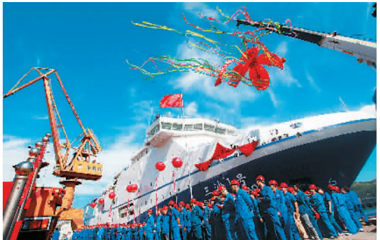
9月3日，海南省三沙市交通补给船“三沙1号”在辽宁葫芦岛正式下水并命名。该船从文昌市清澜港驶往三沙永兴岛的时间为10小时左右。图为“三沙1号”下水仪式现场。