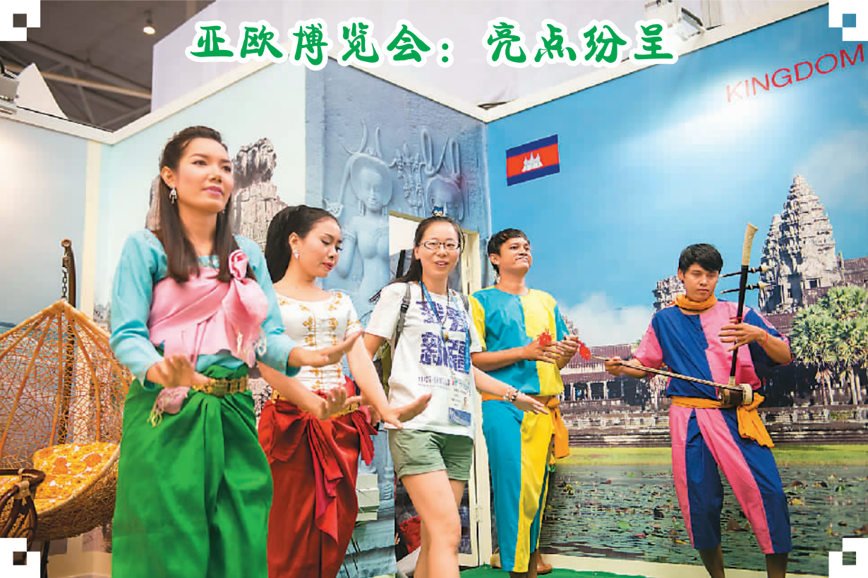
在新疆乌鲁木齐举办的第四届中国—亚欧博览会，精彩纷呈，气氛欢跃，吸引许多观众。图为柬埔寨参展商与观众一起跳民族舞蹈。新华社记者 江文耀摄

今年上半年，中粮集团投资28亿美元收购来宝农业和荷兰农产品及大宗商品贸易商Nidera各51%股权，创下中国粮油行业有史以来境外并购最高纪录；东风汽车以8亿欧元并购标致雪铁龙集团14%股份，实现了从“请进