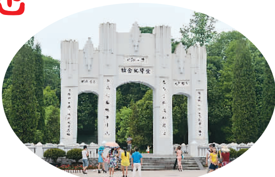
游客在芷江受降纪念馆前参观拍照。