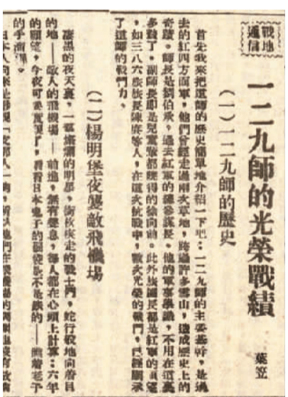
1938年1月10日，《新中华报》报道：129师的光荣战绩之阳明堡夜袭敌机场。

1937年10月中旬，奉命于崞县、代县以东地区侧击敌人的第129师先头部队第769团，进至滹沱河南岸苏龙口、刘家庄一带。该团发现敌机不断由滹沱河北岸的阳明堡机场起落。经周密侦察获悉，该机场有敌机24架，并驻有警卫分队和地勤人员共200余人。据此，第769团首长决心夜袭敌机场。10月19日夜，第769团各部分别向预定地区开进。第3营以两个步兵连和机枪连组成突击队，以一个步兵连作预备队。突击队接近到距敌机约30米时，敌哨兵始发觉，我突击队当即按预定计划发起攻击，一部将敌警卫分队压制于掩蔽部内，并打退其连续反扑；一部迅速扑向敌机群，敌机顿时爆炸起火。此时，敌警卫分队实施反扑，我突击队与敌展开白刃格斗。最终歼敌100余人，毁伤全部敌机24架。完成任务后，部队顺利撤出战斗。