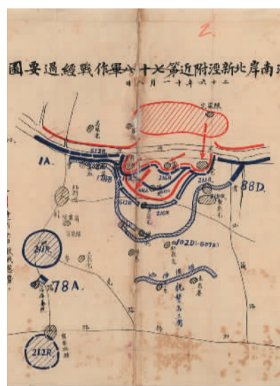
1937年11月8日，第七十八军苏州河南岸北新泾附近作战经过图。

淞沪会战历时3个月，我方夺取了战略主动权，更为我国工矿内迁、保存民族工业实力赢得了宝贵时间。