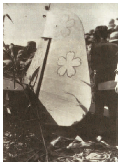
1937年10月，忻口战役中被击落的日军飞机照片。