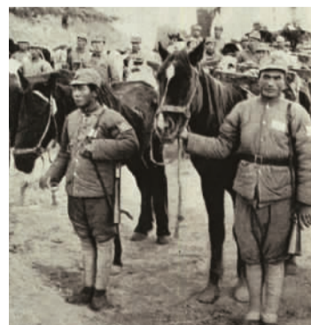
1937年11月，八路军在广阳伏击战中缴获的日军战马。

队主力4000余人通过八路军埋伏区进至松塔，其师团辎重队及1个大队进至广阳地区时，八路军第343旅与敌冲杀，歼日军近1000人。7日，八路军第129师第769、第772、第771团在第343旅配合下，又于广阳以东地区设伏。17时许，设伏的3个团分别向其发起攻击，歼日军250余人。 (据新华社北京8月25日至31日电)