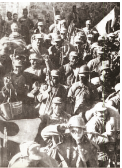
1937年9月26日，平型关战斗胜利后战士们凯旋的照片。

1937年9月中下旬，沿津浦铁路、平汉铁路南下的日军，分别占领河北沧州、保定等地。沿平绥铁路推进的日军进入山西北部，占领天镇、广灵、大同。进驻五台的八路军总部指示第120师从西面驰援雁门关；第115师从东面配合友军作战，对从灵丘增援平型关之敌实施攻击。9月22日，日军第5师团一部首先从灵丘向平型关方向进犯，23日和24日在平型关正面及团城口与中国守军发生激战。9月24日，第115师向平型关东北前进后设伏。9月25日晨，日军第5师团第21旅团一部进入八路军的伏击区，我军歼敌1000余人，击毁汽车100余辆，缴获一批辎重和武器。9月24日至25日，担任钳制、阻击任务的第115师独立团，截断涞源、灵丘之间的交通线，歼敌300余人。