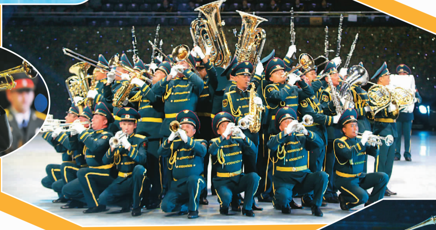
▲ 吉尔吉斯斯坦总参谋部中央俱乐部军乐团在演奏