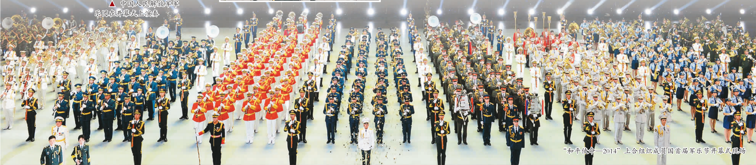
“和平使命—2014”上合组织成员国首届军乐节开幕式现场