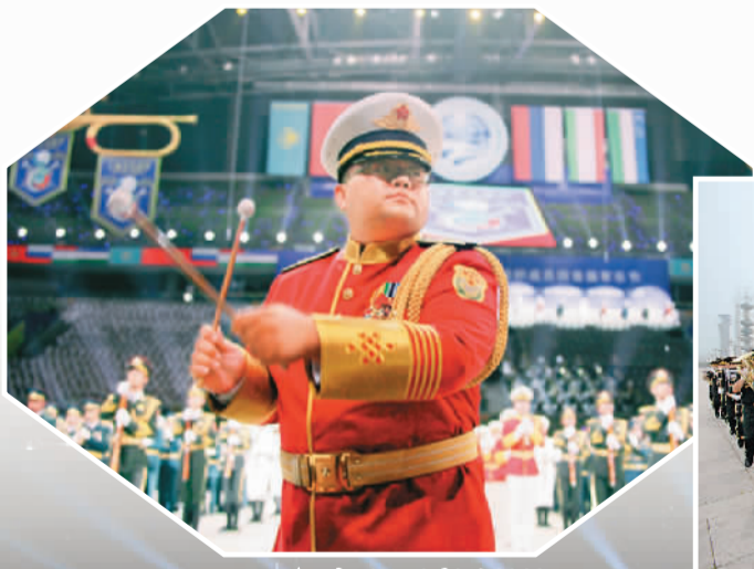
▲ 中国人民解放军军乐团在开幕式上演奏

此次军乐节从8月20日一直延续到29日,跨越了北京和朱日和,共分两个阶段。第一阶段在北京,包括军乐节开幕式暨军乐行进晚会、军乐游行和露天表演两项活动,地点分别在国家体育馆和奥林匹克公园中心区;第二阶段在朱日和训练基地,包括参加“和平使命—2014”上海合作组织成员国武装力量联合反恐军事演习开始仪式、结束仪式暨军乐节闭幕式,为各国参演部队进行慰问演出等活动。