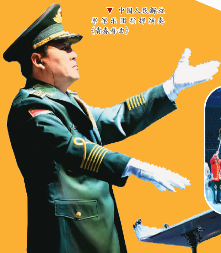
▼ 中国人民解放军军乐团指挥演奏《青春舞曲》

8月28日晚,“和平使命—2014”上海合作组织成员国武装力量联合反恐军事演习军乐行进晚会在内蒙古朱日和拉开帷幕,作为首届军乐节的重要组成部分,5国军乐团280人共同为参加军演的官兵举办慰问演出。