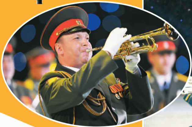
▶ 俄罗斯东部军区司令部军乐团在演奏