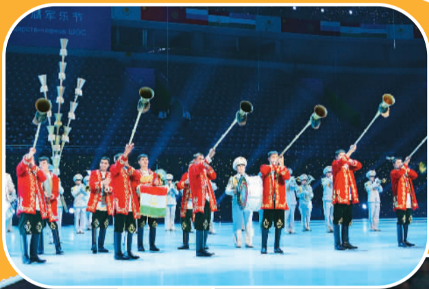
◀ 塔吉克斯坦国防部警备团军乐团在演奏

哈、吉、俄、塔、中军乐团先后登场表演。来自哈萨克斯坦共和国的国防部中央军乐团成立于1995年,他们演奏了《阿拉木图》、《恰恰恰》、《江南STYLE》等作品。吉尔吉斯斯坦总参谋部中央俱乐部军乐团具有悠久历史,前身是成立于1941年的潘菲洛夫军乐队。他们演奏了独具特色的库姆兹弹奏《舍赫列拉达姑娘》、《赛马》、《史诗玛纳斯》、《奔腾》等。俄罗斯派出的东部军区司令部军乐团是该国在远东地区成立最早的军乐团之一,他们演奏了《俄罗斯军歌》、《俄罗斯进行曲》等。来自塔吉克斯坦的国防部警备团军乐团演奏了《奋勇向前进行曲》、《季洛瓦隆进行曲》等,并且用卡尔奈号和多伊拉鼓等特有民族传统乐器配合军乐进行表演,带给观众混搭的试听感受。中国人民解放军军乐团则演奏了《阿坝妹子》、《青春舞曲》等作品。演出在5支军乐团共同演奏本届军乐节主题曲《和平号角》中达到高潮。