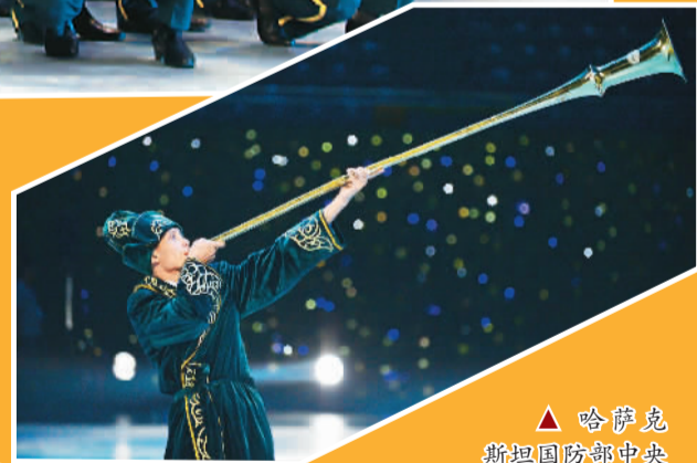
▲ 哈萨克斯坦国防部中央军乐团在演奏

雄壮的 音乐,行进间的 变换表演获得现场观众的好评。在来朱日和基地之前,5国军乐团已经在北京进行过表演。