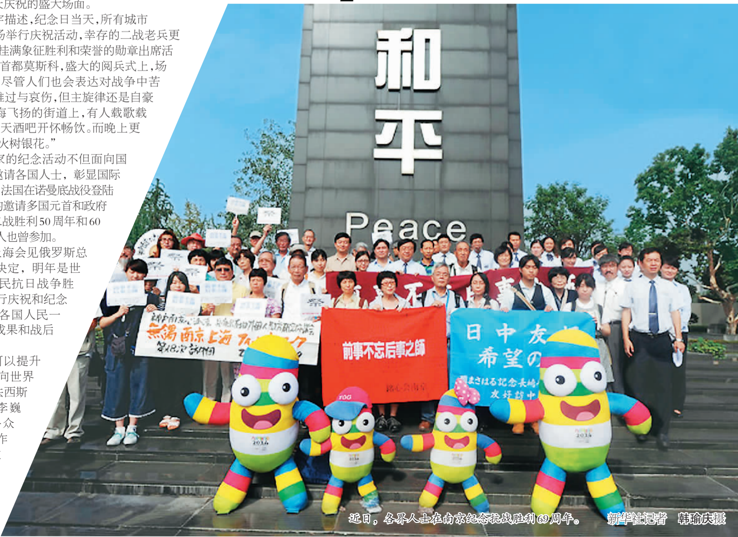
近日，各界人士在南京纪念抗战胜利69周年。