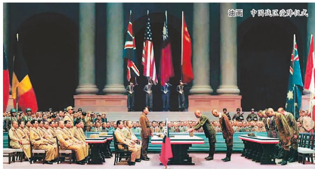
油画 中国战区投降仪式