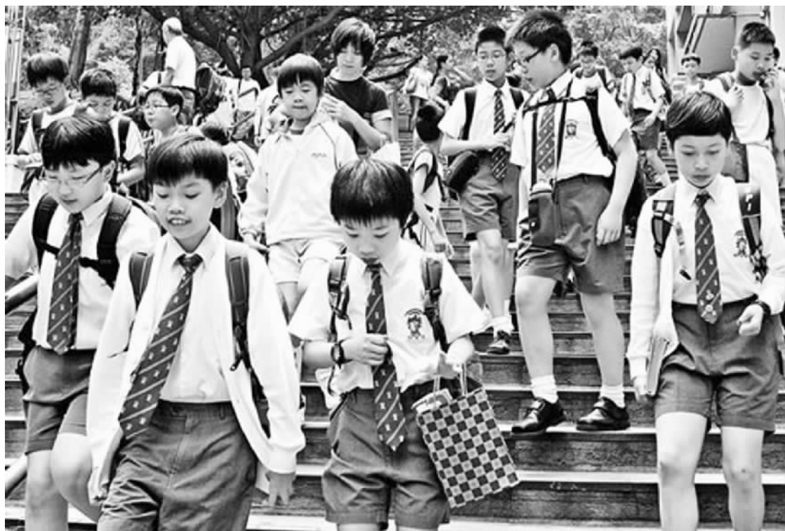
香港湾仔、九龙以及土瓜湾、油麻地一带的名校，由于“统一派位”与学生的居住地址有关，很多家长会选择搬到这些区域居住，或者租住在附近，以便为子女获得申请名校的资格。

“我的小孩就快进幼儿园，要想好搬到哪个好校网？怎样可以知道一个屋苑属于哪个校网？”一位香港家长在网上发布求助帖说。此类关于购买或租住名校区房屋的信息，在香港相当普遍。