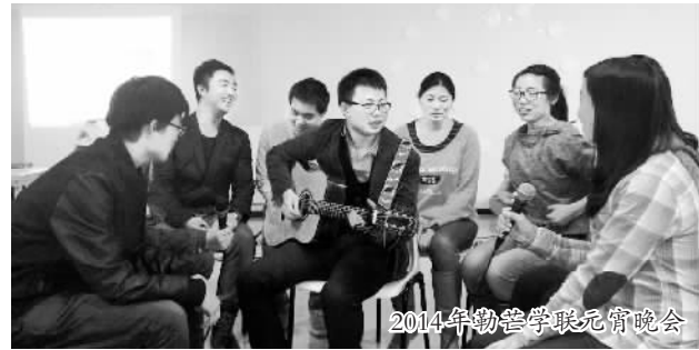
2014年物德学联元宵晚会