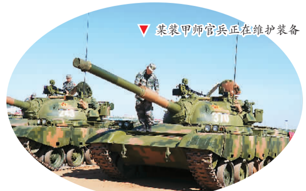
▲某装甲师官兵正在维护装备

陆军战斗群群长、该师师长张利民介绍,前期备战中,他们已经完成40多项专业训练,根据采集的300多组高温条件下战场数据,及时调整了坦克射击参数,命中率提升近10%。他说:“我们有信心有决心完成此次联演,全面展示部队装备水平、训练成果、精神风貌和作战能力。现在,官兵士气高涨、整装待发,随时可以投入到实兵演习中。”