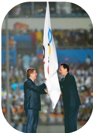
▲南京市市长缪瑞林(右)将奥林匹克会旗交给国际奥委会主席托马斯·巴赫。

本报南京8月28日电(记者贺广华、李中文、马剑)青春梦想没有终点,奥运光芒永不褪色。第二届夏季青年奥林匹克运动会28日晚在南京圆满闭幕。中共中央政治局常委、国务院总理李克强出席闭幕式。