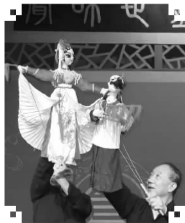
攀柏景区民俗演出中的木偶戏

攀柏景区位于北京市门头沟区斋堂镇，具有历史文物、建筑、美学、社会学等多学科历史文化研究价值，是北方建筑艺术的瑰宝。有着中国最具旅游价值古村落、首批中国传统古村落、首批历史文化名村等众多称号。此次演出季的节目共二十多个，将民俗文化技艺、创新文艺汇演、非物质文化遗产三大元素融为一炉，雅俗共赏。（新宇）