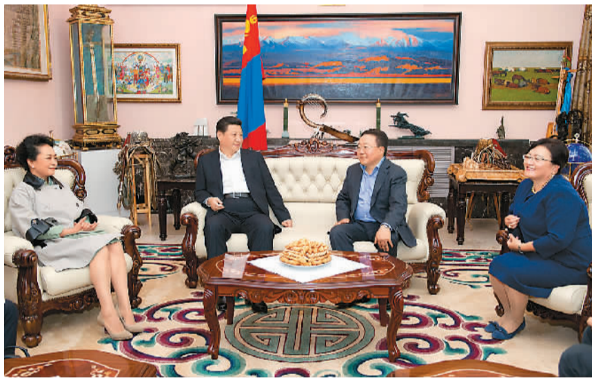
8月22日, 国家主席习近平同蒙古国总统额勒贝格道尔吉再次会晤。