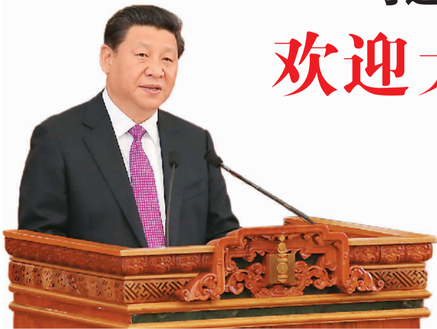
8月22日, 国家主席习近平在蒙古国国家大呼拉尔发表题为《守望相助, 共创中蒙关系发展新时代》的重要演讲。