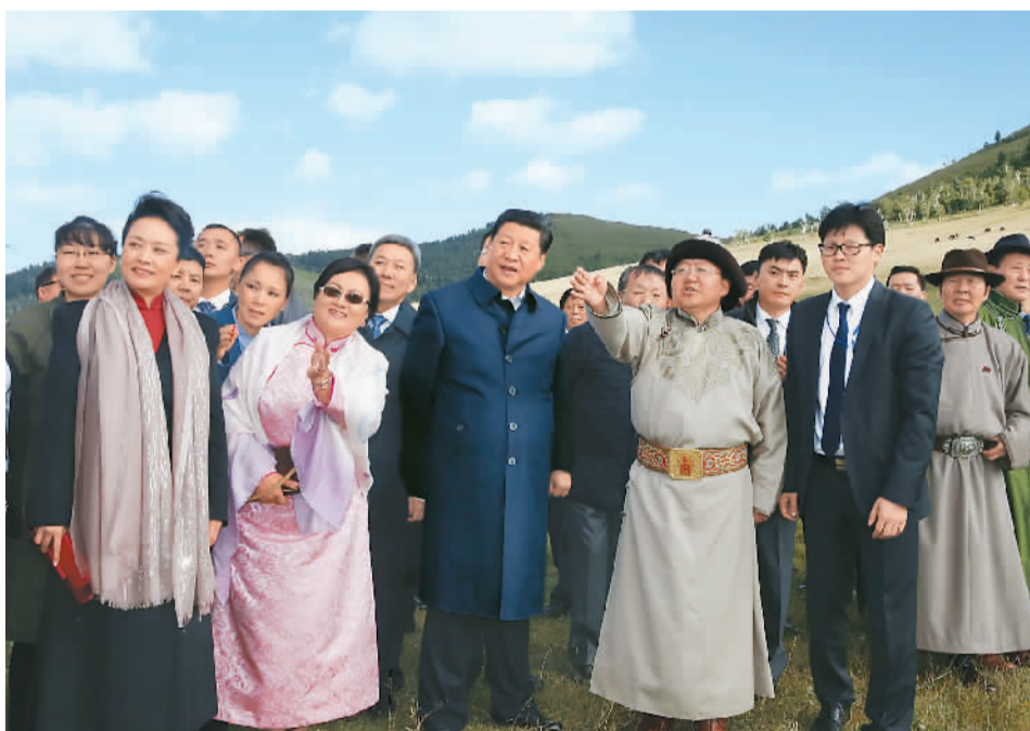
八月二十二日, 国家主席习近平在蒙古国总统额勒贝格道尔吉陪同下前往乌兰巴托市郊观看那达慕。这是习近平和夫人彭丽媛同额勒贝格道尔吉夫妇观看表演。

青春洋溢的姑娘小伙跳起蒙古民间舞蹈。魁梧英勇的摔跤手跨着大步, 进入场内捉对搏斗, 进行力量和技巧的较量。雄姿英发的骑手扬鞭策马, 上下翻滚、左右腾挪, 尽显马背上民族的热情奔放。沉着冷静的射箭手凝神屏气, 箭无虚发。习近平走到射箭手中间, 同他们亲切交谈, 弯弓搭箭。额勒贝格道尔吉和夫人邀请习近平和彭丽媛为比赛优胜者颁奖。 额勒贝格道尔吉向习近平夫妇赠送两匹蒙古马。习近平按照当地习俗给马系上蓝色哈达, 并为两匹马分别取名阿尔泰和克鲁伦, 寓意中蒙两国山水相连、睦邻友好。 蒙古军队乐队演员尽情演唱中蒙歌曲。歌声嘹亮, 乐曲激昂, 轻舞曼妙, 祝愿中蒙友谊地久天长。 王沪宁、栗战书、杨洁篪等参加上述活动。