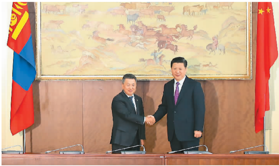
8月22日, 国家主席习近平在乌兰巴托会见蒙古国国家大呼拉尔主席恩赫包勒德。