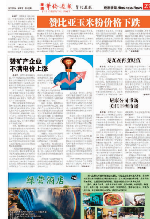
非洲《华侨周报》赞比亚版