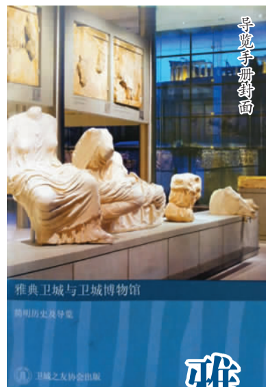
雅典卫城与卫城博物馆 简明历史及导览