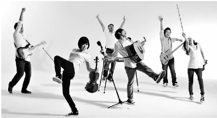
简单生活,简单表演。

如果你喜欢,可以带一块手工香皂、一个手制环保布袋;也可以只是到“平静呼吸”区吸吸氧、看看绿色植物;或者到“歌咏收获”了解一下厨余是如何化成肥料的……简单生活节的主办方希望简