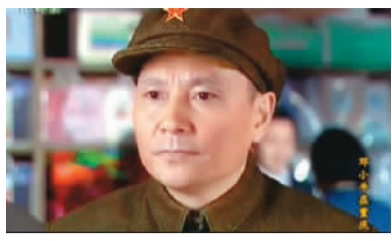
《邓小平在重庆》剧照