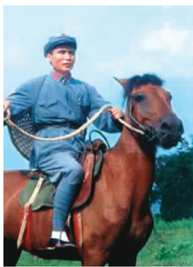
▲《邓小平在会昌》剧照 ▶《童年邓小平》剧照