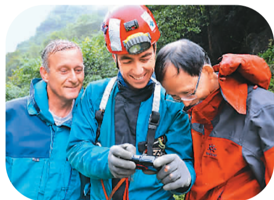
由成都理工大学水文地质专家和法国洞穴专家等21人组成的科考队,日前对湖北省恩施市红土乡红土集镇下的落水洞与清江画廊中的响水洞开展为期15天的科考。