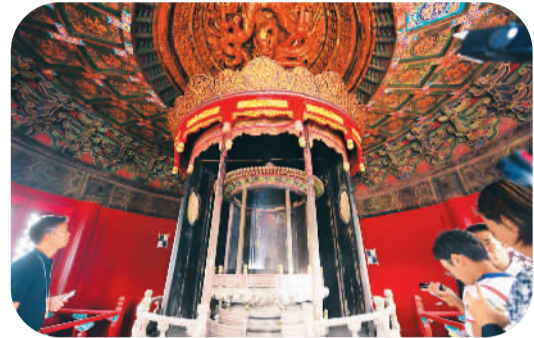
图为大高玄殿建筑群中已修复完工的乾元阁内部木结构神龛。

据悉,该所将组织专家深入探索和总结明清官式建筑的发展历史、建筑形制、营造技艺、保护修复理论与方法,培养专业人才,通过完善明清官式建筑保护研究国家基地,打造古代建筑保护传承国家基地。另据故宫博物院院长单霁翔透露,目前正在修缮的大高玄殿建筑群预计2016年完工。