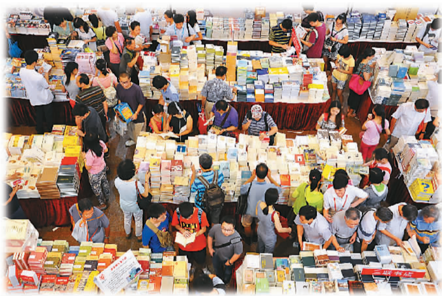
▲ 书展现场。

塞政府和人民的深情厚谊。据新华社拉各斯8月12日电(记者张保平、戴春勇)中国向利比里亚提供抗击埃博拉疫情紧急人道主义援助物资交接仪式12日在利港务局驻地举行。利比里亚总统瑟利夫和中国驻利比里亚大使张越出席交接仪式。