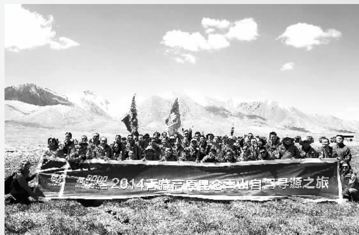
昆仑山挑战6000自驾寻源活动参与者合影