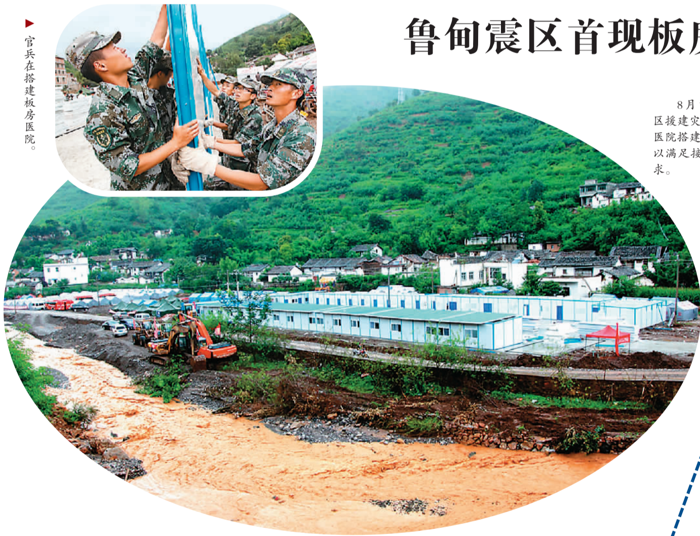
官兵在搭建板房医院。

8月11日，由成都军区援建灾区的板房医院搭建完毕。该医院可以满足接诊量150人的需求。