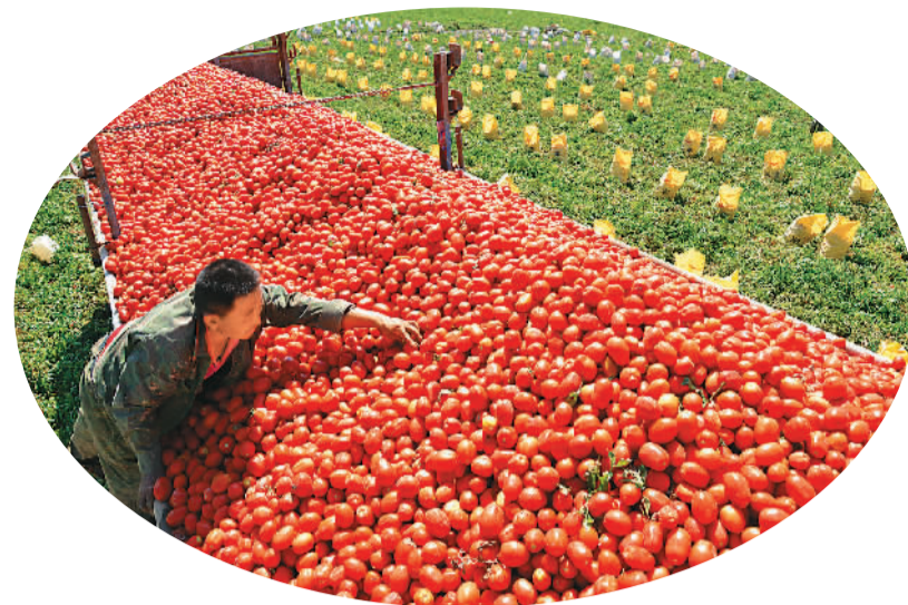
时下，新疆巴音郭楞蒙古自治州新疆生产建设兵团第二师种植的8万亩优质番茄陆续成熟进入采摘期，番茄农户们抓紧时间采收，日均收获量1万余吨。图为农民将采摘的优质番茄装车。