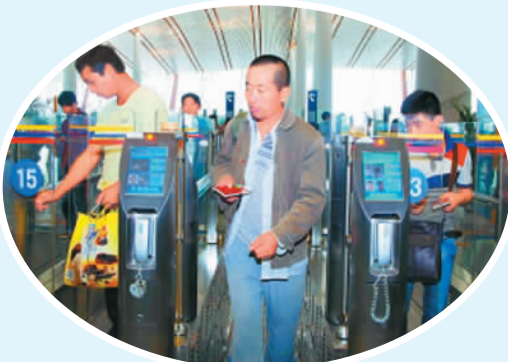
北京首都国际机场T3航站楼自助通关。

目前自助通关在护照上不能加盖验讫章,如有需要盖章的旅客还需要到人工窗口验证通关。