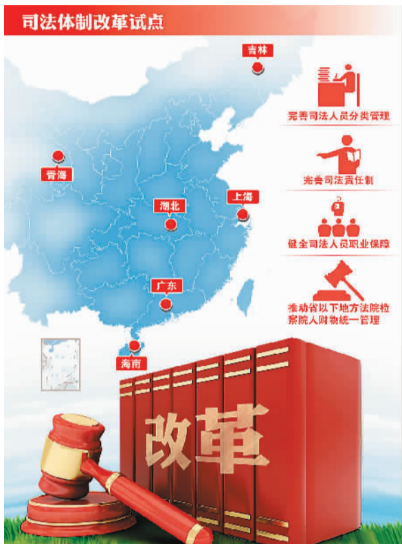
我国选择6个省市进行司法体制改革试点。