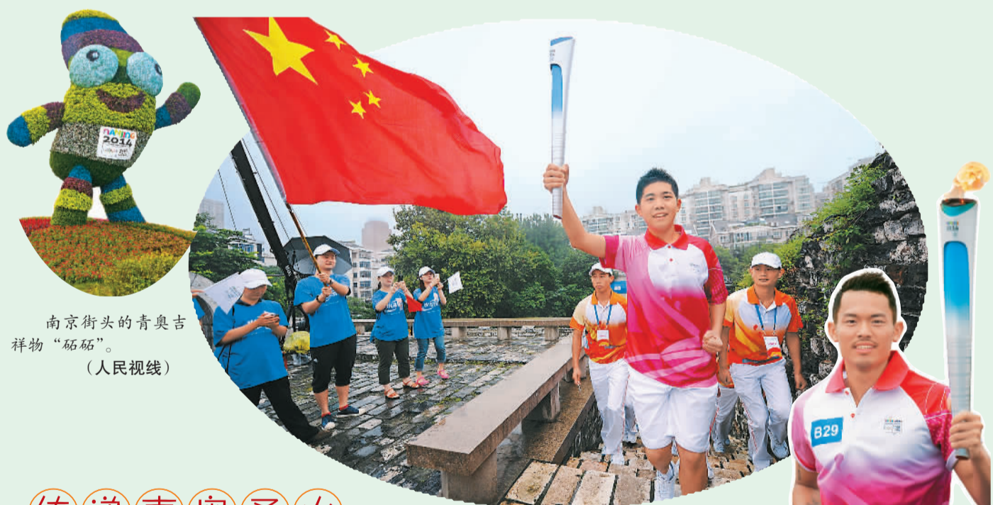
南京街头的青奥吉祥物“砵砵”。