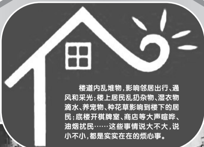
楼道内乱堆物，影响邻居出行、通风和采光；楼上居民乱扔杂物、湿衣物滴水、养宠物、种花草影响到楼下的居民；底楼开棋牌室、商店等大声喧哗、油烟扰民……这些事情说大不大，说小不小，都是实实在在的烦心事。