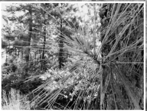
兴林可采脂的湿地松和可采摘的松针