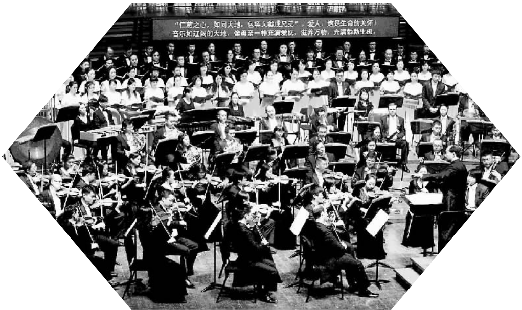
深圳交响乐团演出场景