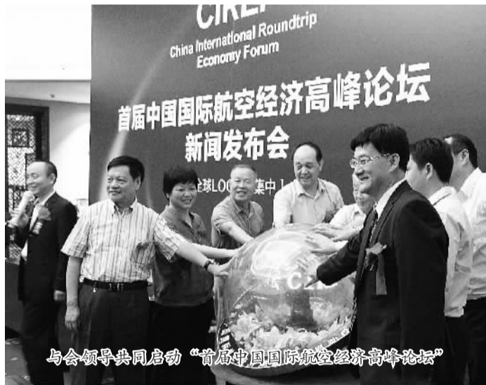
与会领导共同启动“首届中国国际航空经济高峰论坛”

飞行总量达200万小时,未来几年的飞行量增速约19%。2015年,我国通用飞机保有量预测达2500架,2020年将突破9000架,未来几年每年通用飞机保有量增速超过25%。低空逐步放开带来的通用航空产业发展空间巨大,或将撬动起一个潜力巨大的市场。具体来看,通航整机制造需求将超3200亿,并将打破外资主导,取得进口替代空间;通航配套相关的运营、维修培训市场,累计规模将超过3000亿元。此外,空管设备、雷达等细分行业,也有望迎来快速发展,一个迅速崛起的朝阳产业必将形成。