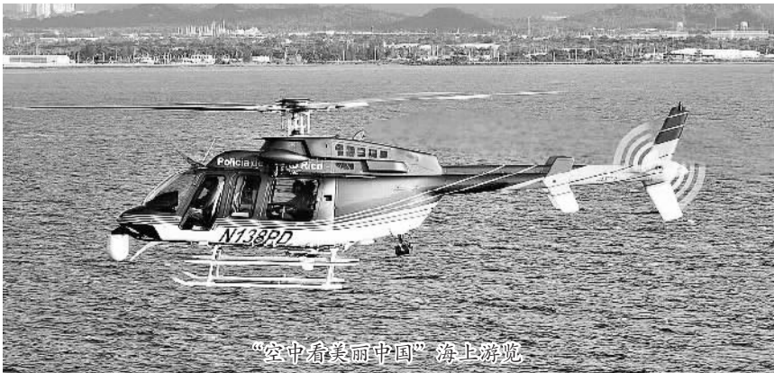
“空中看美丽中国”海上游览

论坛侧重于航空经济等相关产业领域的专业化实战探讨,整合全球航空产业资源,助推中国航空经济发展,力争成为世界上航空经济领域资源广、专业度高、影响力大、颇具权威的年度盛会,为国家顶层设计提供相关资讯。并力争将该论坛打造成为国际航空经济领域的“达沃斯”。通过论坛的交流学习及后续推进,引进航空业及相关产业的核心技术创新团队,根据产业发展的客观规律,实现逐步发展并将筹建国际航空动力发动机研发中心、大飞机拆解及研发中心、国际空乘驾培培训基地、国际航空航天学院、国际航空经济发展基金、国际航空经济产业联盟组织、中国通用航空产业联盟、中国通用航空产业发展基金、中国航空经济与紧急救援公益慈善联合会、中国紧急救援物资储运调拨基地、航空紧急救援培训基地、落地国际航空经济高峰论坛永久性会址等愿景。