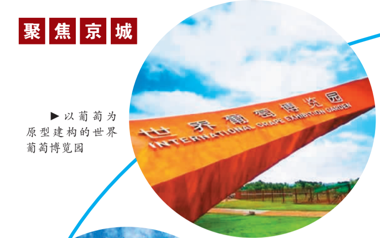
▶以葡萄为原型建构的世界葡萄博览园