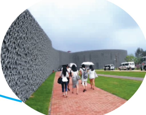
▼以葡萄为原型、以长城灰为主色调的科普馆园内建筑。

利亚、克罗地亚等众多申报国，为北京赢得了2014年世界葡萄大会的举办权。业内人士认为，中国能够获得来自世界25个国家300余名代表的一致认可和广泛支持，不仅说明了中国葡萄和葡萄酒产业在世界葡萄酒生产和消费中扮演着重要的角色，也证明了北京近年来自然环境建设和生态保护取得了令人信服的成果。