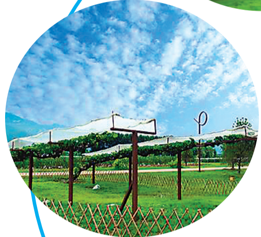
▲博览园内的葡萄架