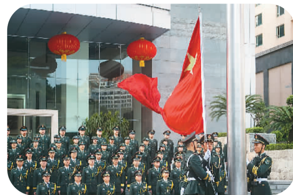
8月1日，解放军驻澳部队在澳门新口岸、飞仔和珠海正岭、洪湾4个军营同步举行升国旗仪式，庆祝建军87周年。