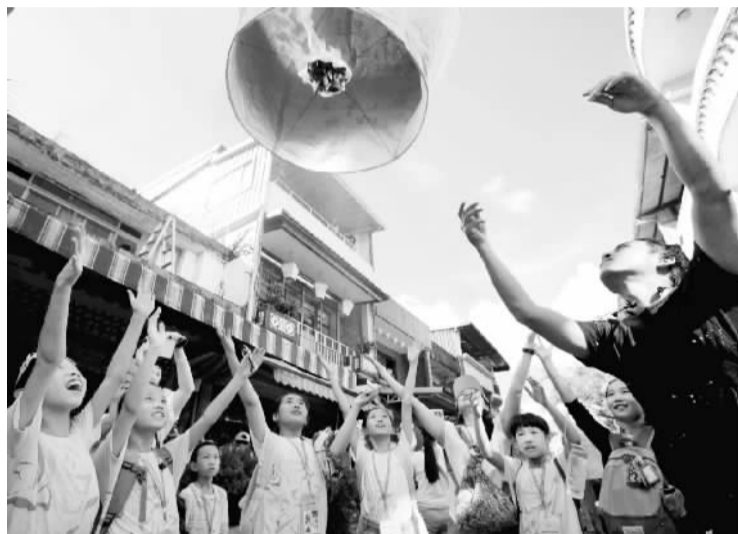
两岸小天使在平溪放天灯

孩子们的世界是五彩斑斓的，孩子们之间的友谊是纯洁无瑕的。我想，没有什么交流能比孩子们在一起，面对面的说笑、手拉手的歌唱、心连心的思念，更让人看到两岸之间血浓于水的亲情，更让人感到两岸关系充满希望的未来。所以，我要把笔交给可爱的孩子们，让他们写出自己的台湾印象，写出自己的感动，写出自己的祝福，也写出自己的爱。