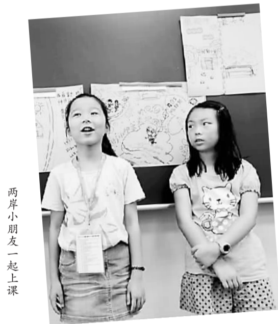
两岸小朋友一起上课