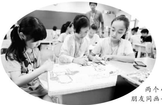
两个小朋友同画一张画

相逢是快乐的，分手总是难舍的。这一次，两岸和平小天使一起心连心，搭起了友谊的桥，我真期待“再一次约会”。