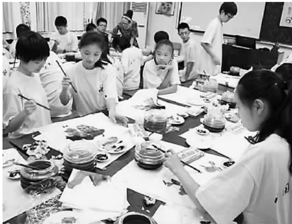
图为丽水华人华侨子女夏令营的营员们跟老师学习国画。

帮助归国“华二代”融入新的环境，让他们放心地在中国安家落户，更是需要全社会的共同努力。