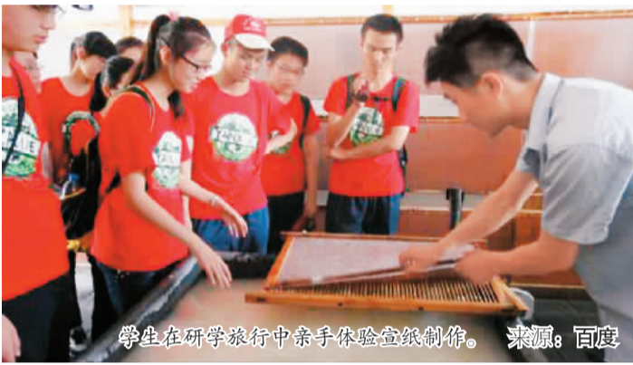
学生在研学旅行中亲身体会造纸制作。

重庆北碚，缙云山下一条青北公路，路的西边是西南大学，路的东边有一小山头，名曰梅花山。梅花山上没有梅花，只有一座坟墓。