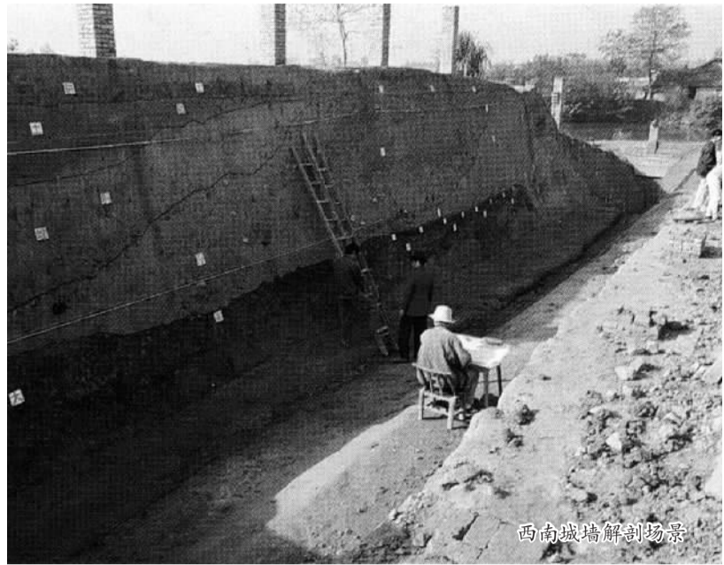
西南城墙解剖场景