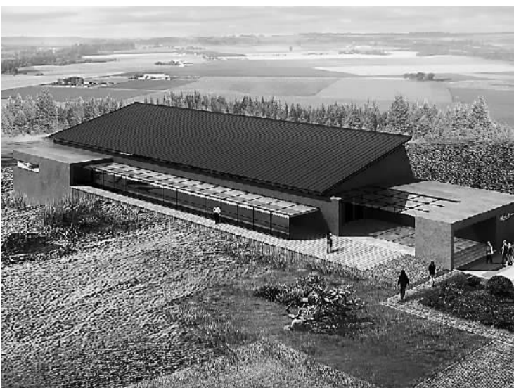
在建的城墙剖面展示馆效果图