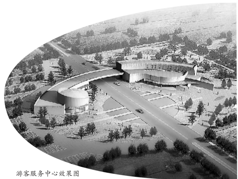
游客服务中心效果图

城头山竟然发现了世界上最早的稻田！1997年冬，城头山东城墙发掘时，发现平行排列着三丘古稻田，灌溉设施已初步配套。用碳十四和光释光测年的方法，测定农田中的泥土下层距今6000到6600年，上层距今6300至6200年。