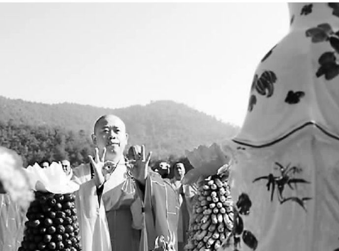
净居寺法师在纪念青原行思禅师诞辰1340年庆典上做法事