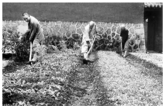
净居寺僧人正在耕种

妙安法师说，净居寺这些年来一系列史无前例的大建设，标志着净居寺新时代已宗风大振，法务昌隆。