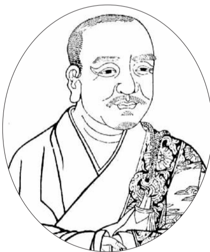
净居寺创始人、禅宗七祖行思法师画像。

他，从家乡安福平田走来。那里的古樟虬枝横溢，盘根错节，像沉吟的哲人。小小年纪的他，时常抚摸古樟斑驳的树皮，仰望古樟直刺青穹的伟岸身躯，思考天地万物之理。