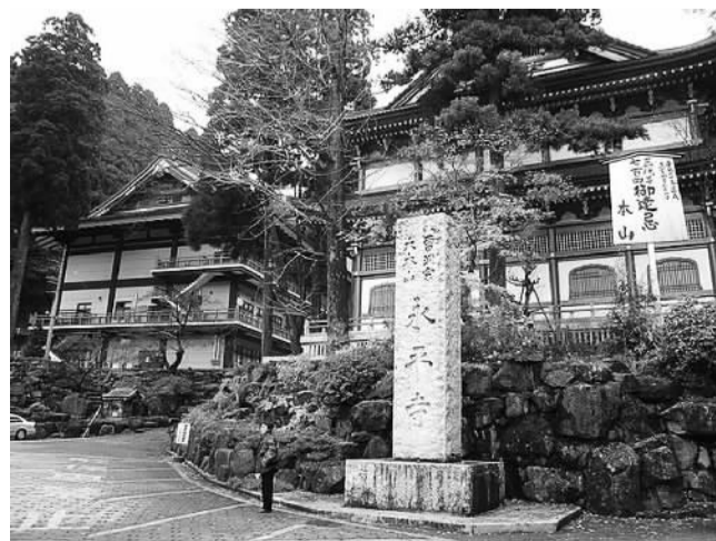
日本曹洞宗大本山永平寺

明延寿法师，有30多位高丽弟子，将此宗佛法传于朝鲜、韩国，直至泰国。而云门宗、临济宗，更是远播欧美。