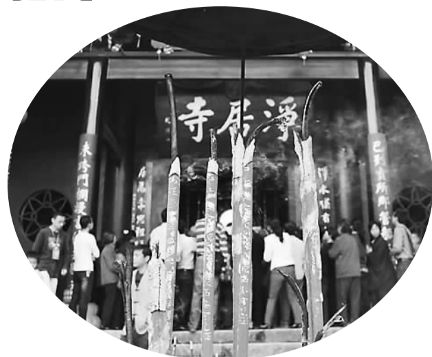
净居寺大殿前香火旺盛