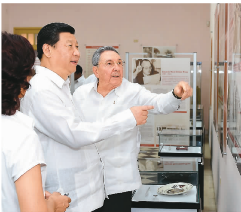
图为习近平和劳尔参观蒙卡达兵营旧址。