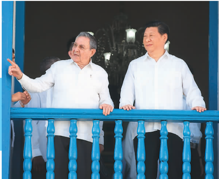
图为习近平在劳尔陪同下参观圣地亚哥市政府时一同走上二层阳台。1959年1月1日,菲德尔·卡斯特罗就是站在这里宣布古巴革命胜利。