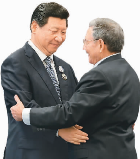
习近平在哈瓦那接受古巴政府授予的「何塞·马蒂」勋章。

本报哈瓦那7月22日电(记者杜尚泽、陈晓航)国家主席习近平22日在哈瓦那接受古巴政府授予的「何塞·马蒂」勋章。「何塞·马蒂」勋章以古巴民族英雄、革命先驱、文学家命名,是古巴最高荣誉勋章。为表彰习近平为促进中古关系作出的杰出贡献和带领中国人民建设中国特色社会主义取得的伟大成就,古巴政府决定向习近平授予该勋章。授勋仪式在革命宫隆重举行。伴随雄壮的进行曲,旗手高举中古两国国旗踏着正步进入大厅,军乐团奏两国国歌。古巴国务委员会秘书长阿科斯塔宣布授勋决定。古巴国务委员会主席兼部长会议主席劳尔·卡斯特罗为习近平佩戴勋章。习近平接受勋章后发表致辞,对古巴政府授予他勋章表示感谢,强调劳尔主席授予我「何塞·马蒂」勋章体现了劳尔主席及古巴党、政府、人民对中国党、政府、人民的友好情谊。中古同为社会主义国家,共同的理想信念和奋斗目标将两国人民紧紧团结在一起。中方对中古关系未来发展充满信心,愿意同古巴做好朋友、好同志、好兄弟,共同推动中古关系不断迈上新台阶。当天,习近平还向何塞·马蒂纪念碑献花圈。