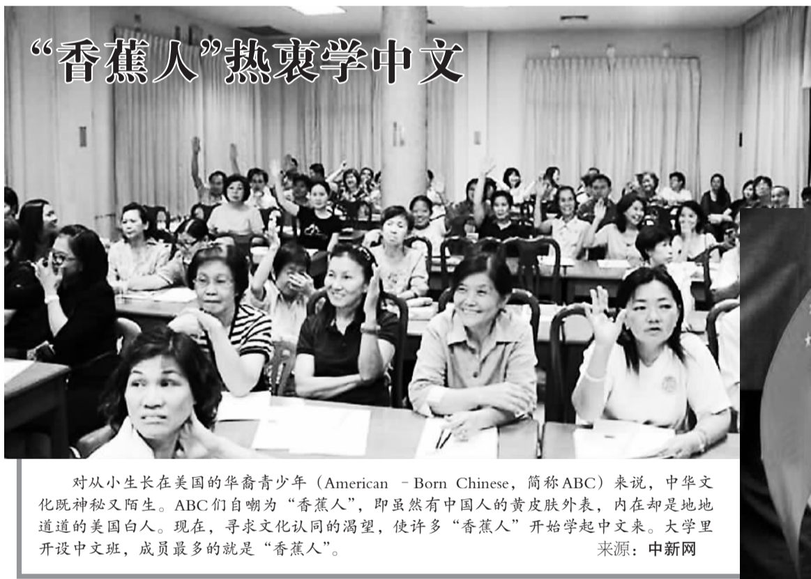
对从小生长在美国的华裔青少年(American-Born Chinese,简称ABC)来说,中华文化既神秘又陌生。ABC们自嘲为“香蕉人”,即虽然有中国人的黄皮肤外表,内在地却是地地道道的美国白人。现在,寻求文化认同的渴望,使许多“香蕉人”开始学起中文来。大学里开设中文班,成员最多的就是“香蕉人”。