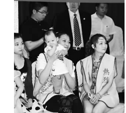
台北江西会馆，嫁到台湾的江西女儿带着孩子迎接家乡人。

进入7月，台湾增添了江西元素：街上有大巴车上印着“老家哪里 幸福赣州”的大字，南昌成为第四批开放赴台个人游城市，赣台经贸文化交流大会首次在台湾举办。江西省委书记强卫21日抵台即向迎接的江西籍台湾老乡展示浓浓乡情：“我是进口老表，各位都是出口老表，我一直想到台湾来探亲访友，今天梦想成真。”