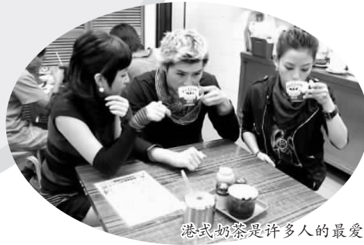
港式奶茶是许多人的最爱

随着港式奶茶的推广，奶茶文化也成为香港旅游的一大特色，不少游客都会专门到当地特色的茶餐厅一品香港奶茶的醇厚与丝滑。香港咖啡红茶协会副主席黄浩均介绍，近几年港式茶餐厅在内地愈见愈多，一线城市都有上百间茶餐厅，并且在二三线城市也发展良好。