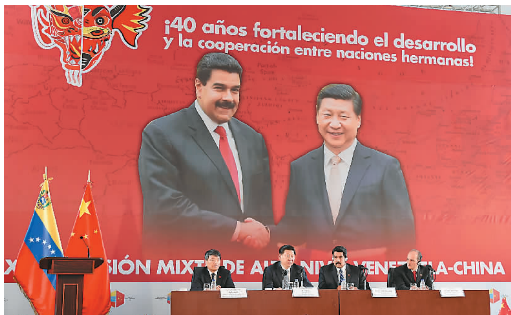
当地时间7月21日,国家主席习近平在加拉加斯和委内瑞拉总统马杜罗共同出席中国—委内瑞拉高级混合委员会第十三次会议闭幕式。