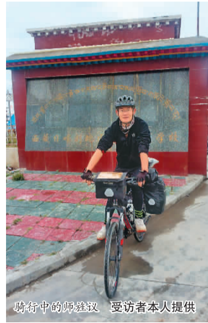
骑行中的师旗

他没再见过那个西藏老婆婆,但如今依然记得那面饼的味道。“很香很香,像祖母的味道。”