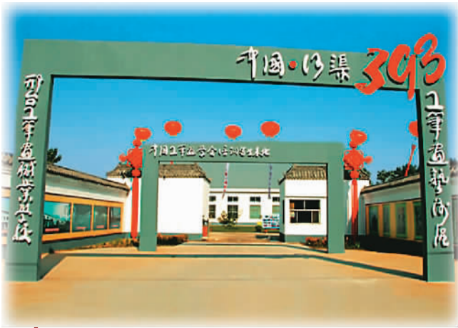
河北宁晋县河渠393工笔画艺术区一景（资料图片）