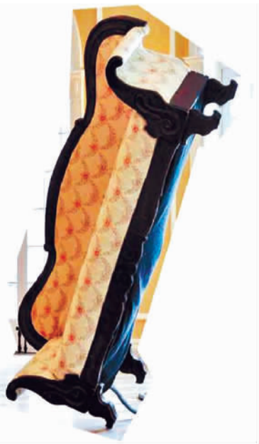
源于内部的平衡（机电雕塑） 雅各布·托斯基