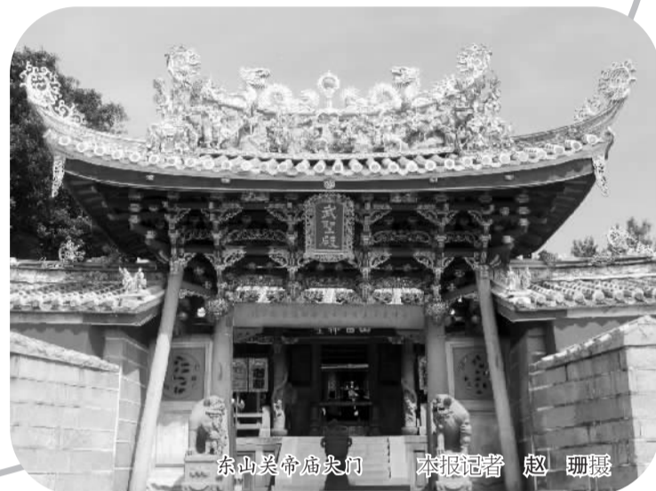
东山关帝庙大门