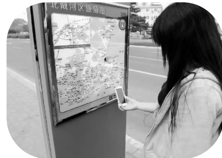
游客体验北戴河智慧旅游

这是笔者第三次来到北戴河,没想到时隔几年,北戴河变化如此之大。点击进入网站上的“360度全景展示”,北戴河全景地图跃入眼帘。点击地图上相应的景区,便可看到景区内360度实景视频。行至鸽子窝公园,手机突然提示有WiFi信号,原来这是北戴河“智慧旅游区”项目一部分——免费上网服务。