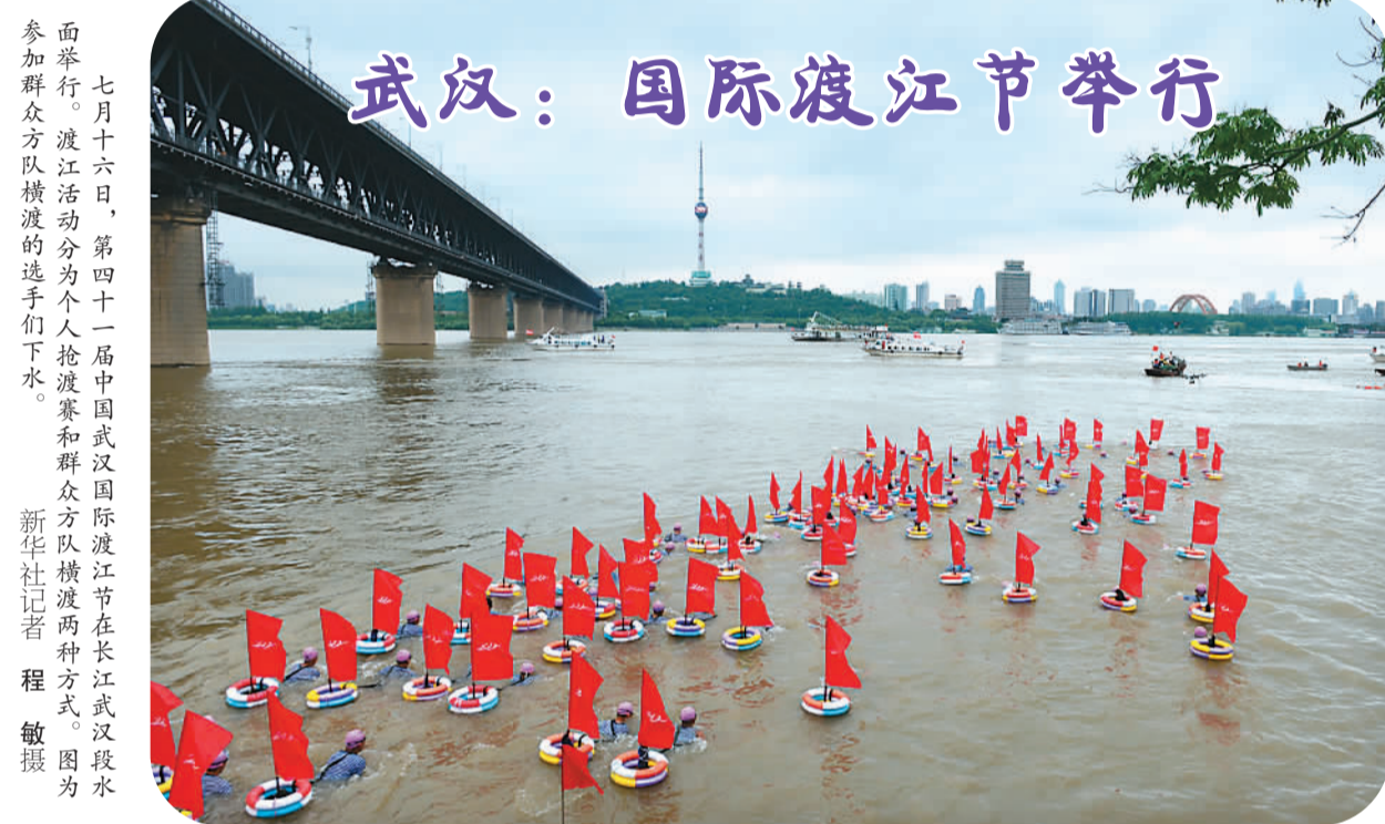
七月十六日，第四十届中国武汉国际渡江节在长江武汉段水面举行。渡江活动分为个人抢渡赛和群众方阵队横渡两种形式。图为参加群众方阵队横渡的选手们下水。

不打无准备、无把握之仗。在腐败问题上，要紧盯矿产资源、土地出让、房地产开发、工程项目、惠民资金和专项经费管理等方面的突出问题。在“四风”问题上，要盯住享乐主义、奢靡之风方面的问题，也要关注形式主义、官僚主义问题，重点发现顶风违纪行为。在纪律问题上，要加强对党纪的纪律报告、组织纪律执行情况的检查，重点发现有令不行、有禁不止，组织涣散、纪律松弛问题。在选人用人问题上，要重点发现买官卖官、带病提拔、超编制配备干部和“裸官”等问题，做好领导干部个人有关事项报告抽查工作。选好人、用对人是头等大事，选对一人、造福一方，选错一人、贻害无穷。