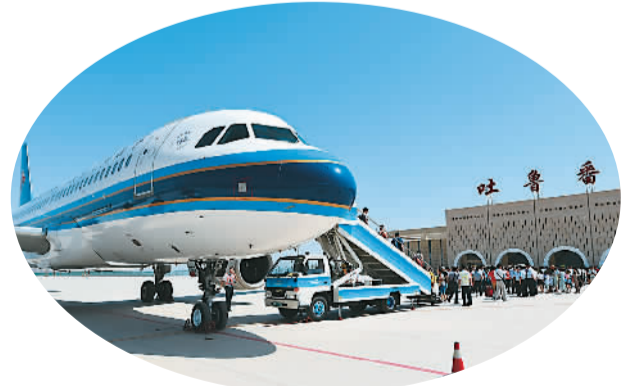
7月15日，长沙至吐鲁番（经停银川）航班首次正式通航。该航线由南航湖南分公司的空客A320飞机执飞，每周二、六共两班。图为飞机降落在吐鲁番机场。