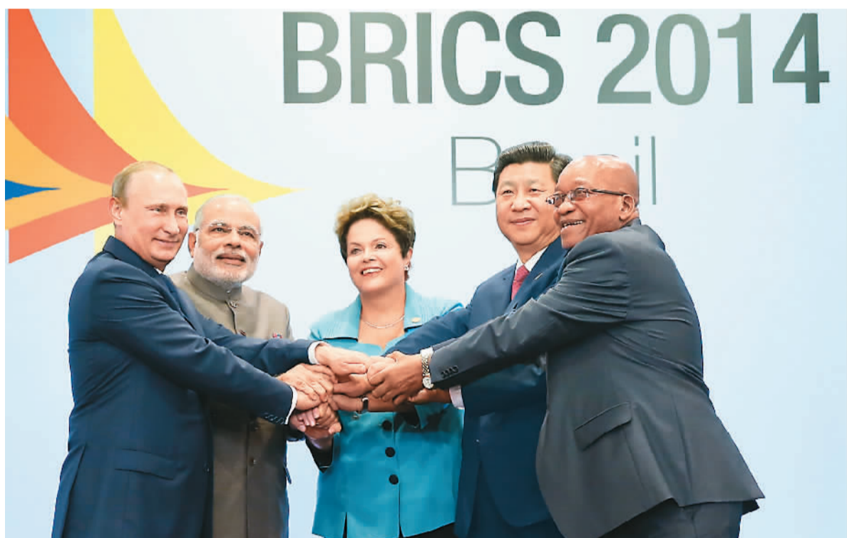
7月15日, 习近平同出席会晤的巴西总统罗塞夫、俄罗斯总统普京、印度总理莫迪、南非总统祖马合影。