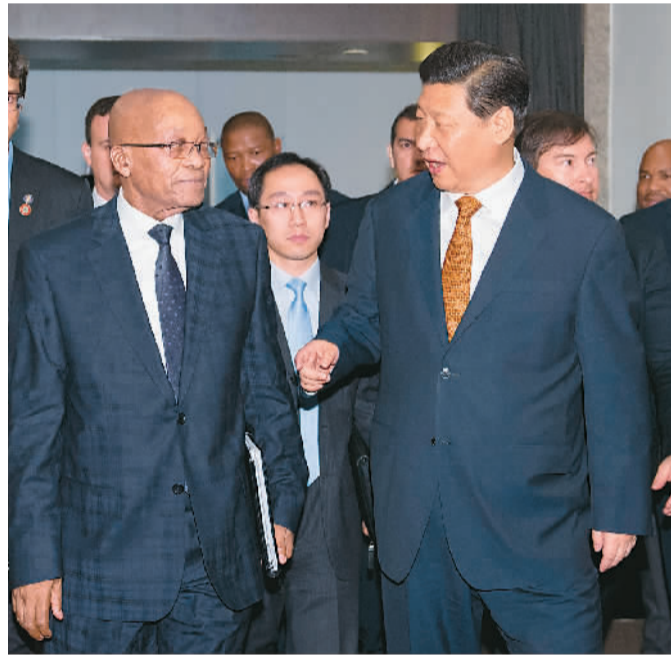
七月十四日,国家主席习近平在巴西福塔莱萨会见南非总统祖马。