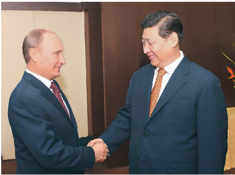
七月十四日,国家主席习近平在巴西福塔莱萨会见俄罗斯总统普京。