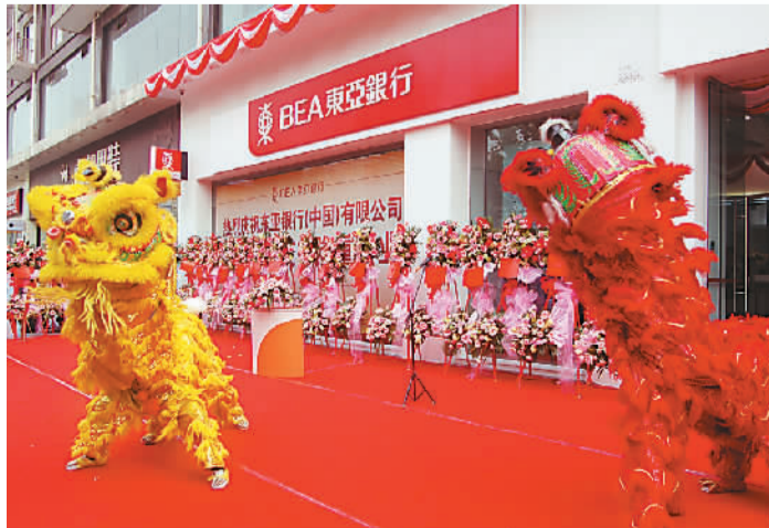
东亚银行“中国风”浓郁的开业典礼