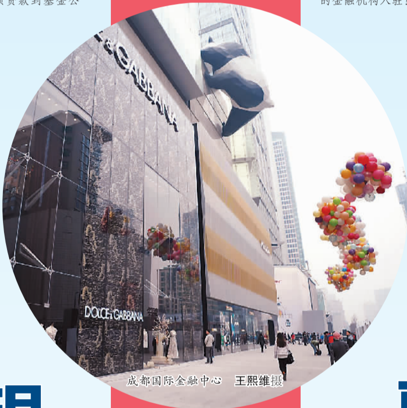
成都国际金融中心