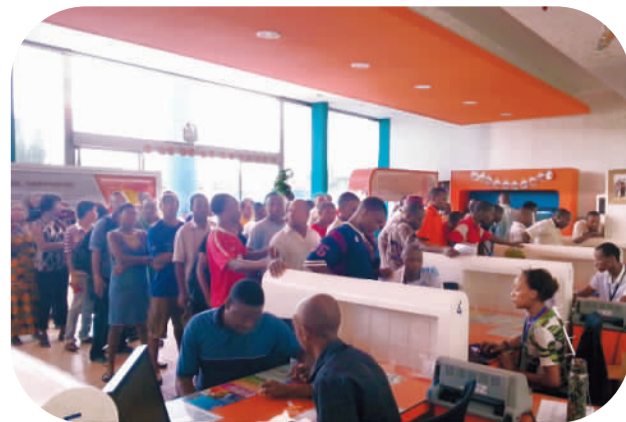
坦桑尼亚客户争相购买数字电视机顶盒