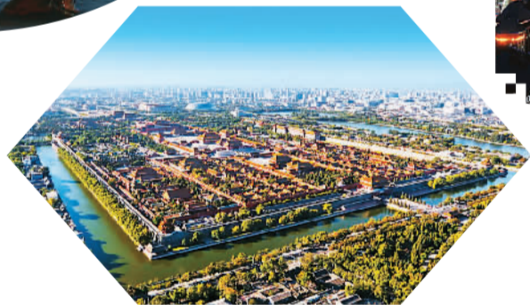
故宫全景。