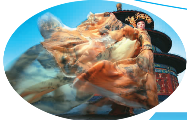
祭坛之舞。