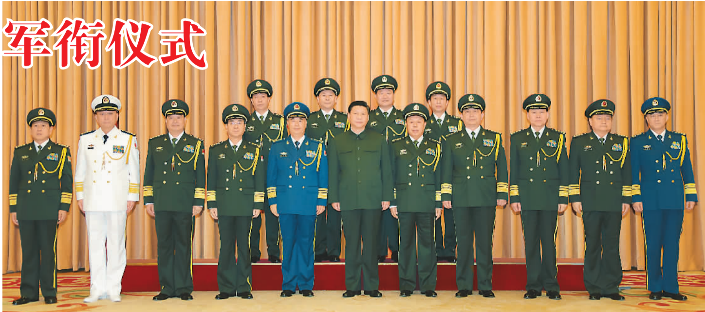
图为晋升上将军衔仪式结束后, 习近平等领导同志同晋升上将军衔的军官合影留念。