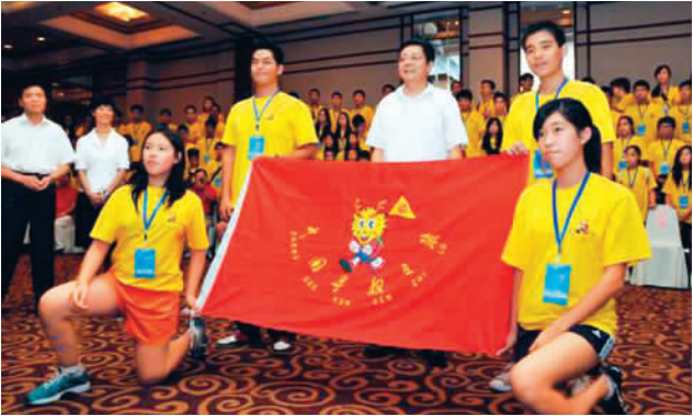
开营仪式。 《中国寻根之旅》夏令营西安(资料图片)

只有收起浓厚的说教味道,抛弃成人的想法,真正了解孩子们的心理,才能让这些海外华裔少年在祖国的大好河山中游历忘返,成为夏令营的“常客”。也相信我们的寻根之旅一定能拉近祖国与海外华裔少年的距离。