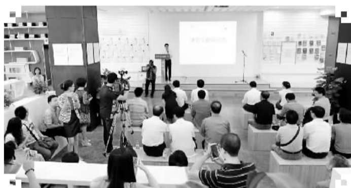
右图：市民文化大讲堂十年800期特别活动“讲堂文化研讨会”现场。