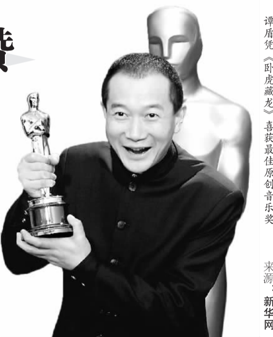
谭盾凭《卧虎藏龙》喜获最佳原创音乐奖