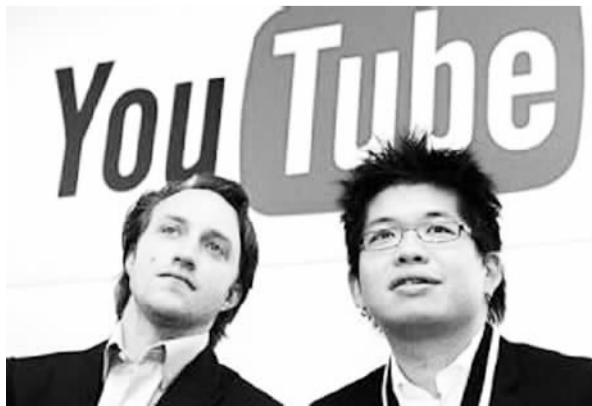
YouTube创始人陈士骏(右)和查德·赫利

尽管华裔在海外受到了肯定与赞扬,但不容忽视的是,美国社会种族偏见的潜流却一直时隐时现,海外社会对华裔的种族偏见与歧视诽谤从未停止,即便