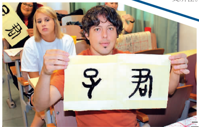
图二：展示书法习作

近日，为期两周的美国南卡罗来纳大学孔子学院2014年汉语夏令营圆满结束，营员们获得了由北京语言大学颁发的结业证书。