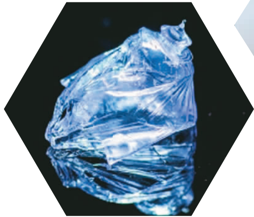
不起眼的美丽（雕塑） 林诗浩 广州美术学院