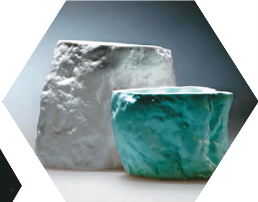
山石美器（设计） 刘泽延 中央美术学院